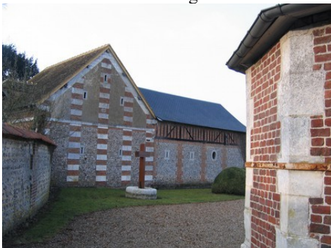
Une ferme à l'architecture soignée