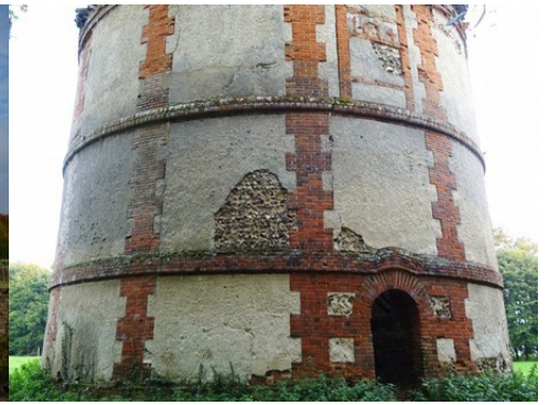
Le colombier circulaire