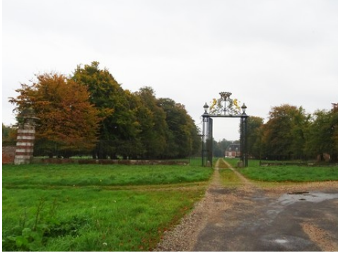
L'accès au domaine et le portail d'entrée