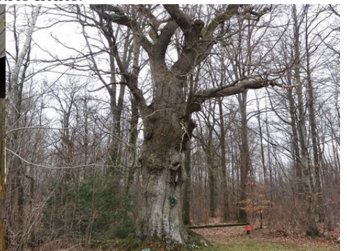
Le chêne à la Vierge