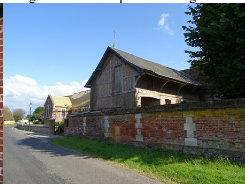
Le bâti rural aux alentours