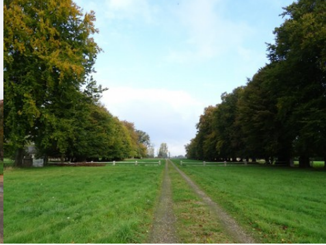
La perspective nord depuis le château