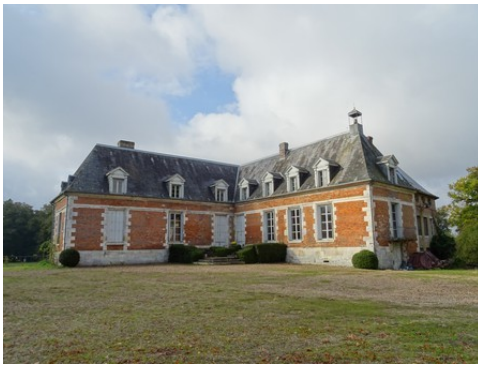
Le château vu depuis la cour d'honneur