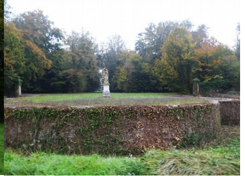
Les aménagements des jardins