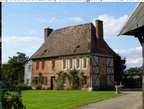
Une gentilhommière proche de l'église