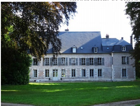
Le château voisin de Bosguérard

Les avis seront cohérents avec ceux émis ces derniers années, à savoir : pas de maisons à volume compliqué (type V, W, Y, ou Z), pentes à 45° pour les volumes principaux, ardoise ou tuile plate de teinte brun vieilli, à 20u/m 2 , avec un débord de toiture de 20cm, enduit de teinte beige clair avec modénatures (au choix : chaînages, encadrement de fenêtres, soubassement, colombage...). *Voir les autres fiches.