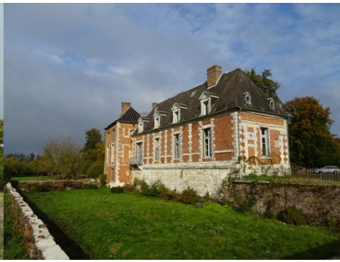
La façade sud vue depuis les jardins